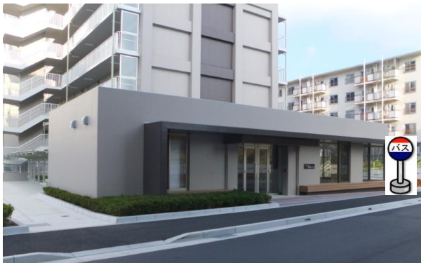
⑤新桜の宮住宅第1集会所前 集会所前でお待ち下さい。