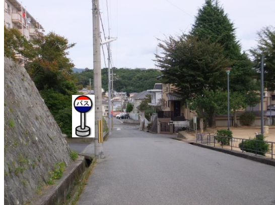
⑥出坂山公園 公園の反対側でお待ちください。