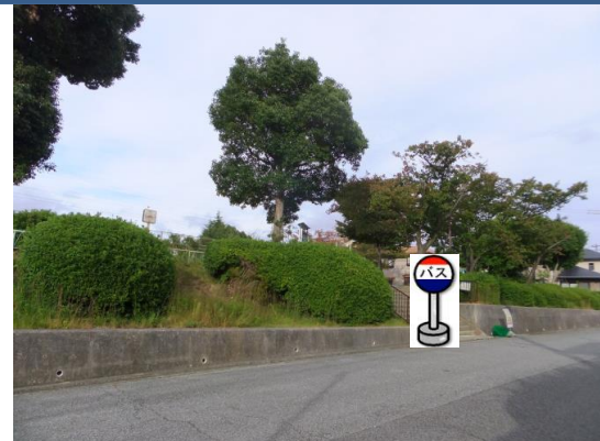
⑨若葉台公園前 公園南側入り口付近でお待ち下さい