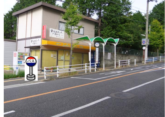
⑦北鈴蘭台駅前 中央病院行きバス停付近でお待ち下さい