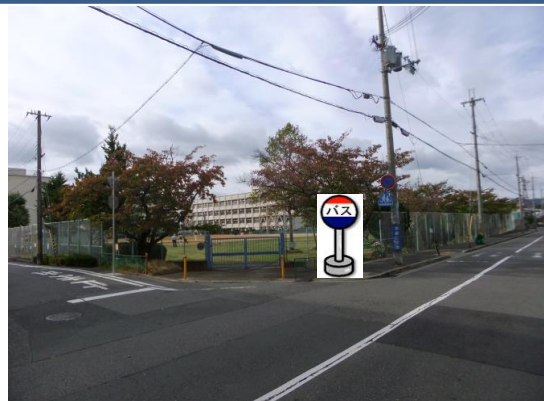
⑧市立桜の宮小学校(東南側) 小学校東南側の角でお待ち下さい