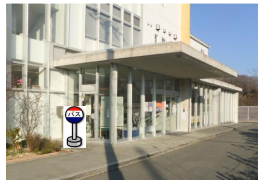
⑨こやまクリニック(正面玄関前) 神戸ほくと病院をご利用の方は こちらでお待ち下さい。