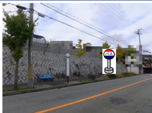
⑥泉橋バス停付近 中央病院行きバス停付近でお待ち下さい。