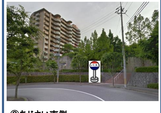
⑧あじさい南側 ライブシティの階段前辺り でお待ちください。