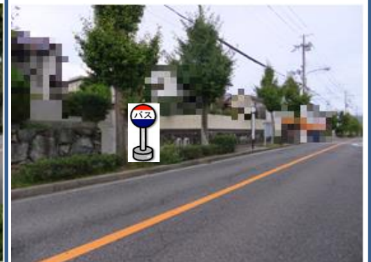
④西畑公園(泉台4丁目バス停付近) 中央病院行きバス停付近でお待ち下さい。