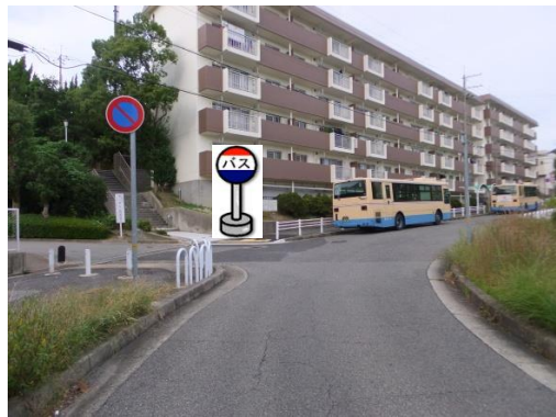
②鈴蘭台第2住宅バスロータリー 泉台7丁目バス停の手前でお待ち下さい。