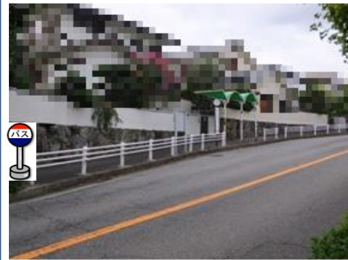
③泉台5丁目バス停付近 中央病院行きバス停付近でお待ち下さい。