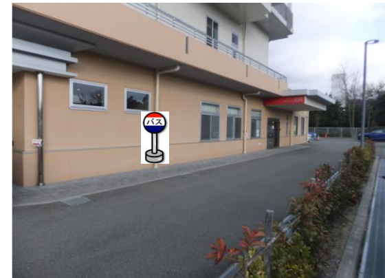
⑩神戸ほくと病院 こやまクリニックをご利用の方は こちらでお待ち下さい。

ご利用の行き先のバスに ご乗車できなかった場合は、 こやまクリニックで乗換して下さい。