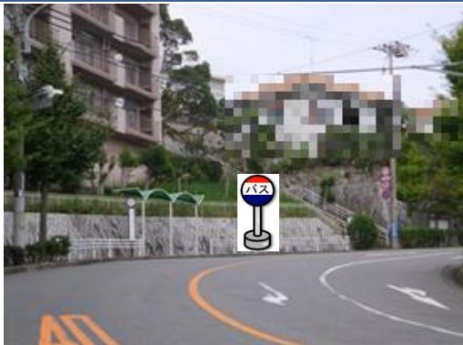
⑤泉台2丁目バス停付近 中央病院行きバス停付近でお待ち下さい。