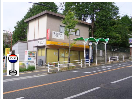
⑦北鈴蘭台駅前 中央病院行きバス停付近でお待ち下さい。