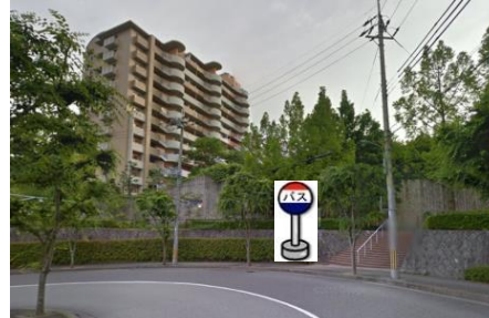
⑪あじさい南側 ライブシティの階段前辺りでお待ちください。