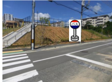
③北山公園東側 北山公園の東側でお待ち下さい。(午後便と 停車位置が異なりますのでご注意下さい。)