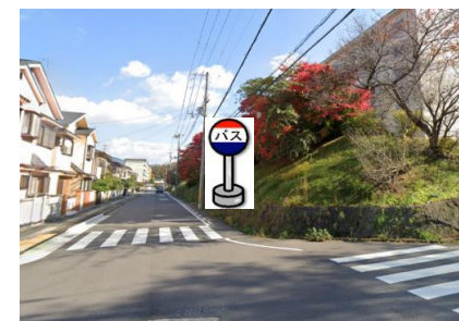
④桜の宮北 13号棟の北側でお待ち下さい。