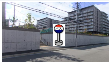
⑦甲栄台4丁目13 階段下 サンヴィラ北鈴の向かい側でお待ち下さい。 乗車の際は段差に注意して下さい。