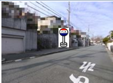
⑤緑町7丁目三差路北 階段下でお待ち下さい。