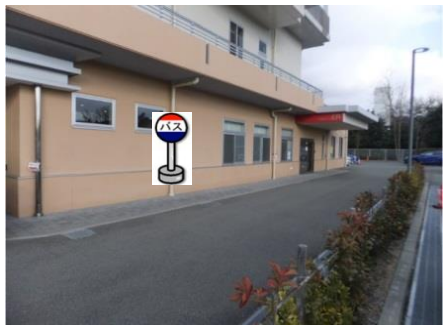
⑬神戸ほくと病院 こやまクリニックをご利用の方は こちらでお待ち下さい。 ご利用の行き先のバスに ご乗車できなかった場合は、 こやまクリニックで乗換して下さい。