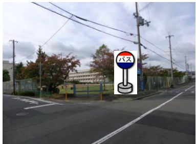
⑨市立桜の宮小学校(東南側) 小学校東南側の角でお待ち下さい。