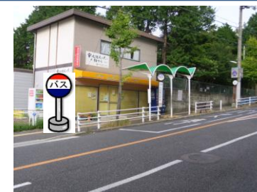
⑧北鈴蘭台駅前 中央病院行きバス停付近でお待ち下さい。