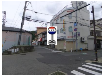
②植戸電気前 植戸電気さんの入り口付近でお待ち下さい。