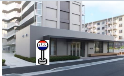
⑥新桜の宮住宅第1集会所前 集会所前でお待ち下さい。 乗車の際は段差に注意して下さい。