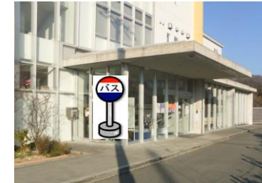
⑫こやまクリニック(正面玄関前) 神戸ほくと病院をご利用の方は こちらでお待ち下さい。