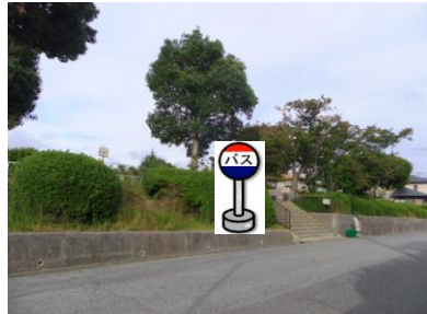
⑩若葉台公園前 公園南側入り口付近でお待ち下さい。