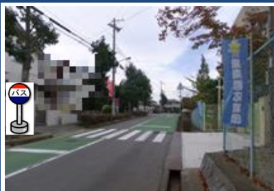
⑨星和台小学校付近 小学校の北西側でお待ち下さい。