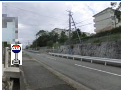
②鈴蘭台第5団地35号棟前 35号棟前の反対側でお待ち下さい。