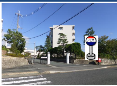
⑩ゆうゆうの里前 南西側の入り口付近で お待ち下さい。