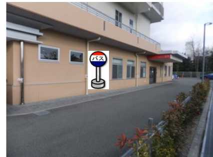
⑱神戸ほくと病院 こやまクリニックをご利用の方は こちらでお待ち下さい。

ご利用の行き先のバスに ご乗車できなかった場合は、 こやまクリニックで乗換して下さい。