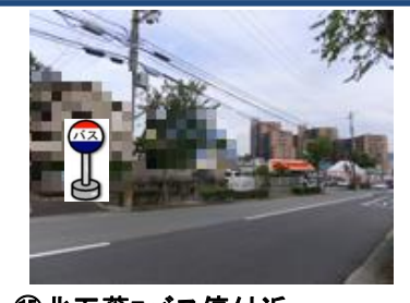
⑮北五葉7バス停付近 オートバックスの南西側の 交差点付近でお待ち下さい。