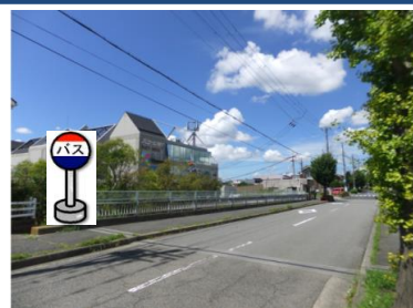
⑧星和台跨道橋 星和台跨道橋西向きでお待ち下 さい。