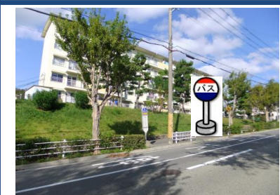
⑭北五葉3バス停付近 谷上行きバス停付近でお待ち下さい。