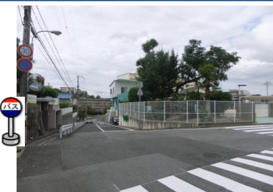
⑥聖ミカエル南五葉幼稚園付近 幼稚園向いの歩道付近で お待ち下さい。