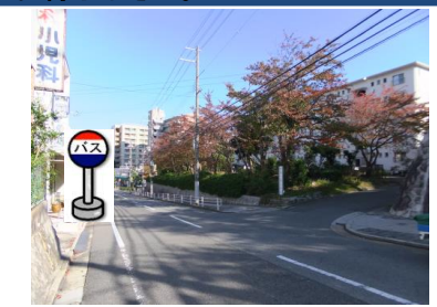
⑪鈴蘭台第3団地1号棟前 反対側の歩道付近でお待ち下さい。