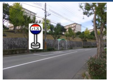
⑬北五葉2バス停付近 谷上行きバス停付近でお待ち下さい。