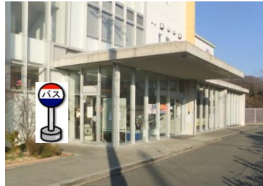
⑰こやまクリニック(正面玄関前) ほくと病院をご利用の方はこちらでお待ち下さい。