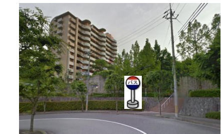
⑯あじさい南側 ライブシティの階段前辺りでお待ちください。