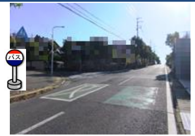
⑦貴船坂上交差点 貴船前の坂を上った最初の 交差点付近でお待ち下さい。