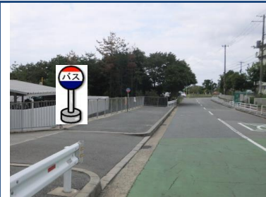
④君影小学校バス停付近 (7棟行き側)君影小前のバス停 付近でお待ち下さい。