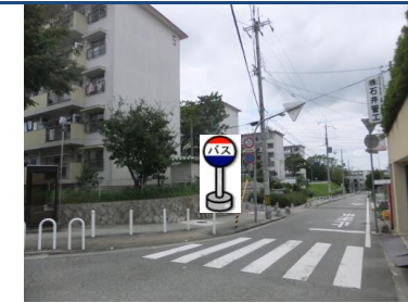
⑤鈴蘭台第5団地 第5号棟ゴミステーション前 看板付近でお待ち下さい。