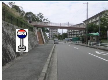
③睦橋下バス停付近 (小学校行き側) 橋の下でお待ち下さい。