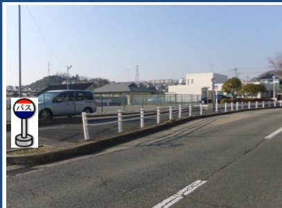
④惣山1丁目バス停付近 バス停付近でお待ちください。