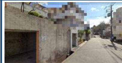
⑩横山医院前 横山医院さんの前辺りで お待ちください。