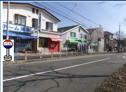
②神戸中央病院バス停付近 バス停付近でお待ちください。