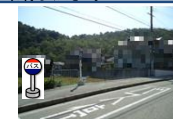
⑬中里2丁目バス停付近 中里町行きバス停付近で お待ちください。