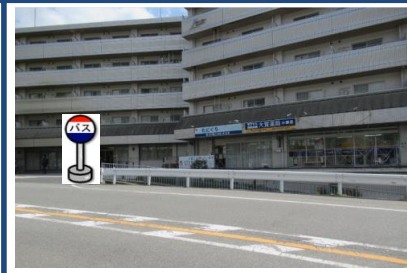
⑤リパティーベル六甲 たにぐちクリニック前 でお待ちください。