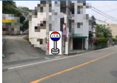
⑦鈴蘭台東口バス停付近 中央病院行きバス停付近で お待ちください。