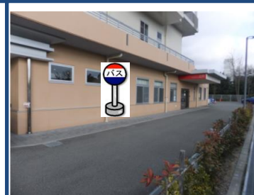
⑲神戸ほくと病院 こやまクリニックをご利用の方は こちらでお待ち下さい。 ご利用の行き先のバスに ご乗車できなかった場合は、 こやまクリニックで乗換して下さい。