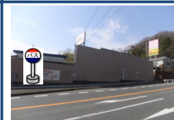
⑮二軒茶屋バス停付近 谷上行きバス停付近で お待ちください。