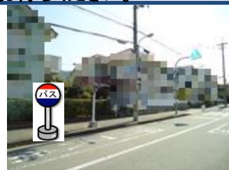
⑪中里北公園バス停付近 中里町行きバス停付近で お待ちください。