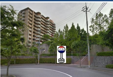
⑰あじさい南側 ライブシティの階段前辺り でお待ちください。