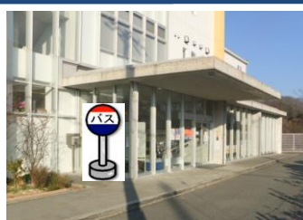
⑱こやまクリニック(正面玄関前) ほくと病院をご利用の方は こちらでお待ち下さい。