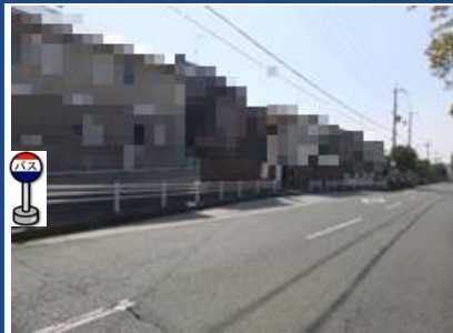
③惣山4丁目バス停付近 バス停付近でお待ちください。