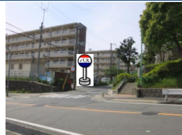
⑨東町公園前 郵便ポストの前辺りで お待ちください。