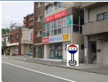
⑥京進スクールワン付近 京進スクールワン付近で お待ちください。