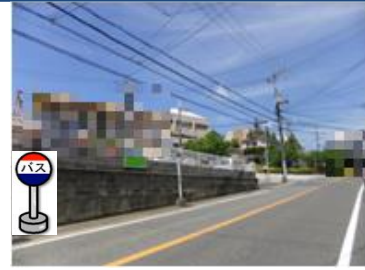
⑧親和女子大前バス停付近 谷上行きバス停付近で お待ちください。