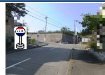
⑭中里町バス停付近 中里町行きバス停付近で お待ちください。