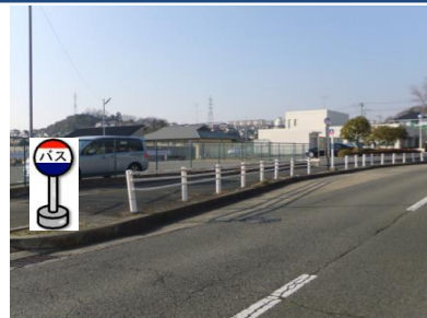
④惣山1丁目バス停付近 バス停付近でお待ちください