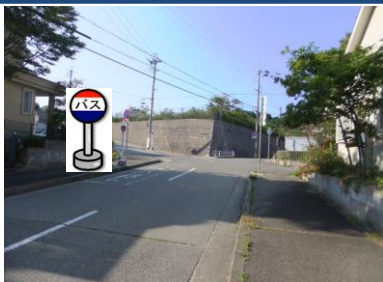
⑭中里町バス停付近 中里町行きバス停付近でお待ちください