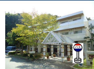
⑤リハビリティーベル六甲 正面玄関前でお待ちください