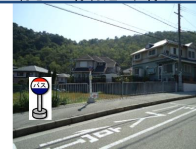
⑬中里2丁目バス停付近 中里町行きバス停付近でお待ちください