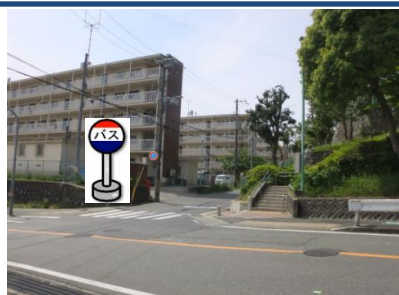
⑩東町公園前 郵便ポストの前辺りでお待ちください