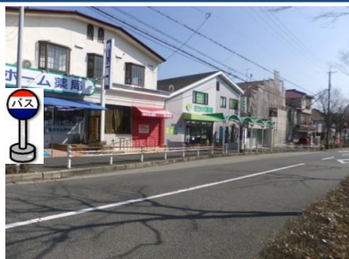
②神戸中央病院バス停付近 バス停付近でお待ちください