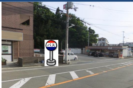
⑥公民館前バス停付近 鈴蘭台行きバス停付近でお待ちください