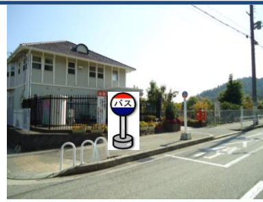
⑫中里中公園バス停付近 中里町行きバス停付近でお待ちください