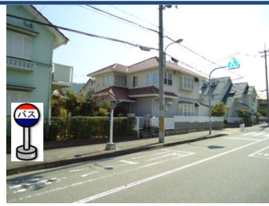
⑪中里北公園バス停付近 中里町行きバス停付近でお待ちください