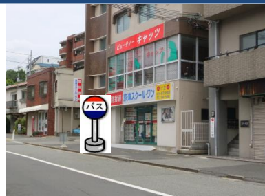
⑦京進スクールワン付近 京進スクールワン付近でお待ちください