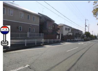
③惣山4丁目バス停付近 バス停付近でお待ちください