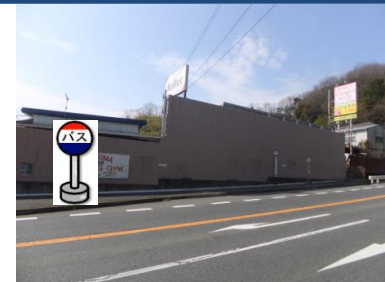
⑮二軒茶屋バス停付近 谷上行きバス停付近でお待ちください