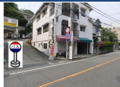
⑧鈴蘭台東口バス停付近 中央病院行きバス停付近でお待ちください