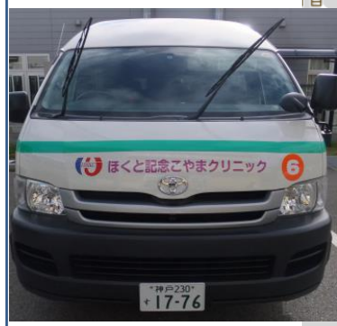
⑦京進 スクールワン付近