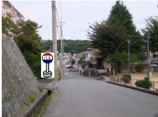
⑤出坂山公園 公園の反対側でお待ちください。