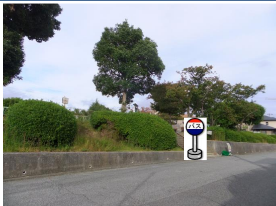
⑧若葉台公園前 公園南側入り口付近でお待ち下さい