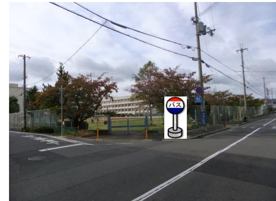
⑦市立桜の宮小学校(東南側) 小学校東南側の角でお待ち下さい