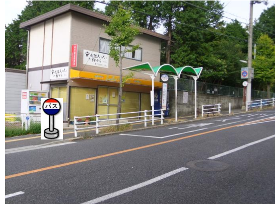
⑥北鈴蘭台駅前 中央病院行きバス停付近でお待ち下さい