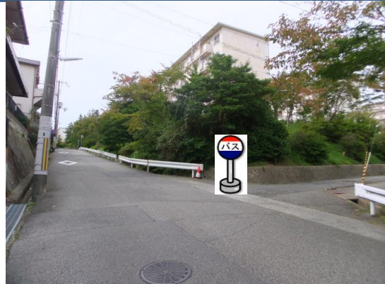
③市営桜の宮住宅1号棟前 1号棟の向い側、8号棟の角あたりでお待ち下さい