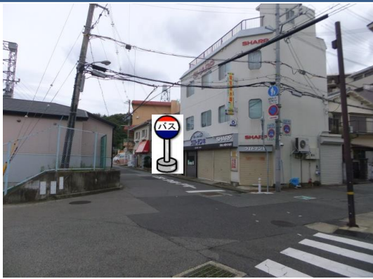
②植戸電気前 植戸電気さんの入り口付近でお待ち下さい