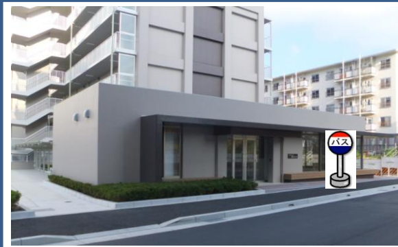
④新桜の宮住宅第1集会所前 集会所前でお待ち下さい。