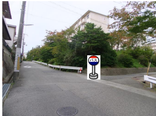
③市営桜の宮住宅1号棟前 1号棟の向い側、8号棟の角あたりでお待ち下さい