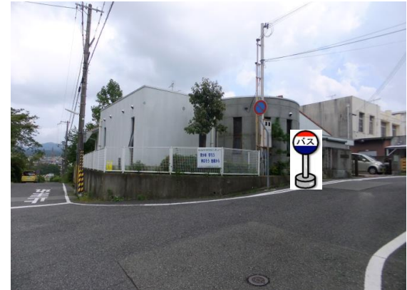
④市立桜の宮地域福祉センター前 福祉センター正面入り口付近でお待ち下さい