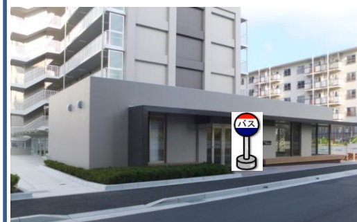
④新桜の宮住宅第1集会所前 集会所前でお待ち下さい。