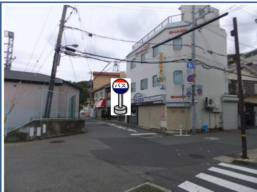
②植戸電気前 植戸電気さんの入り口付近でお待ち下さい。