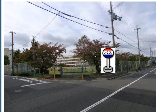
⑦市立桜の宮小学校(東南側) 小学校東南側の角でお待ち下さい。