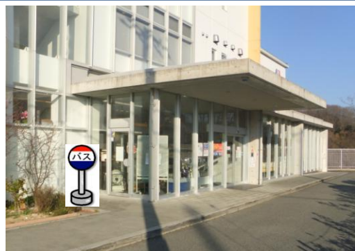
⑨こやまクリニック(正面玄関前) 神戸ほくと病院をご利用の方は こちらでお待ち下さい。