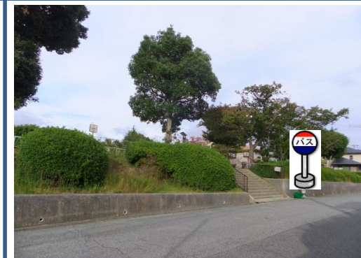
⑧若葉台公園前 公園南側入り口付近でお待ち下さい。