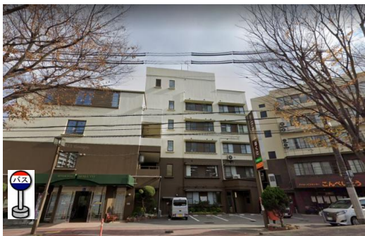
①シニアホームほくと 正面玄関前でお待ち下さい。