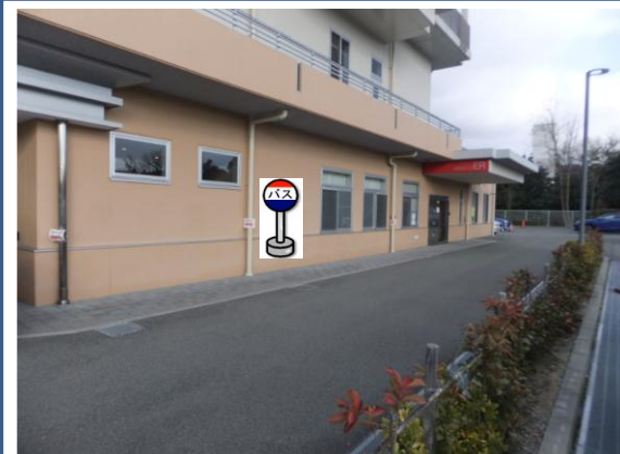
⑩神戸ほくと病院 こやまクリニックをご利用の方は こちらでお待ち下さい。

ご利用の行き先のバスに ご乗車できなかった場合は、 こやまクリニックで乗換して下さい。