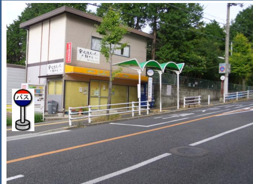
⑥北鈴蘭台駅前 中央病院行きバス停付近でお待ち下さい。