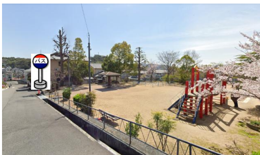
⑤出坂山公園 公園前でお待ちください。