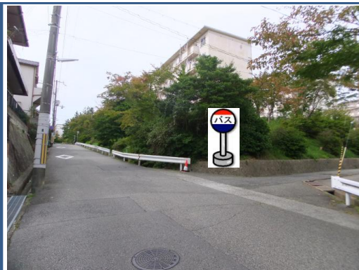
③市営桜の宮住宅1号棟前 1号棟の向い側、8号棟の 角あたりでお待ち下さい。